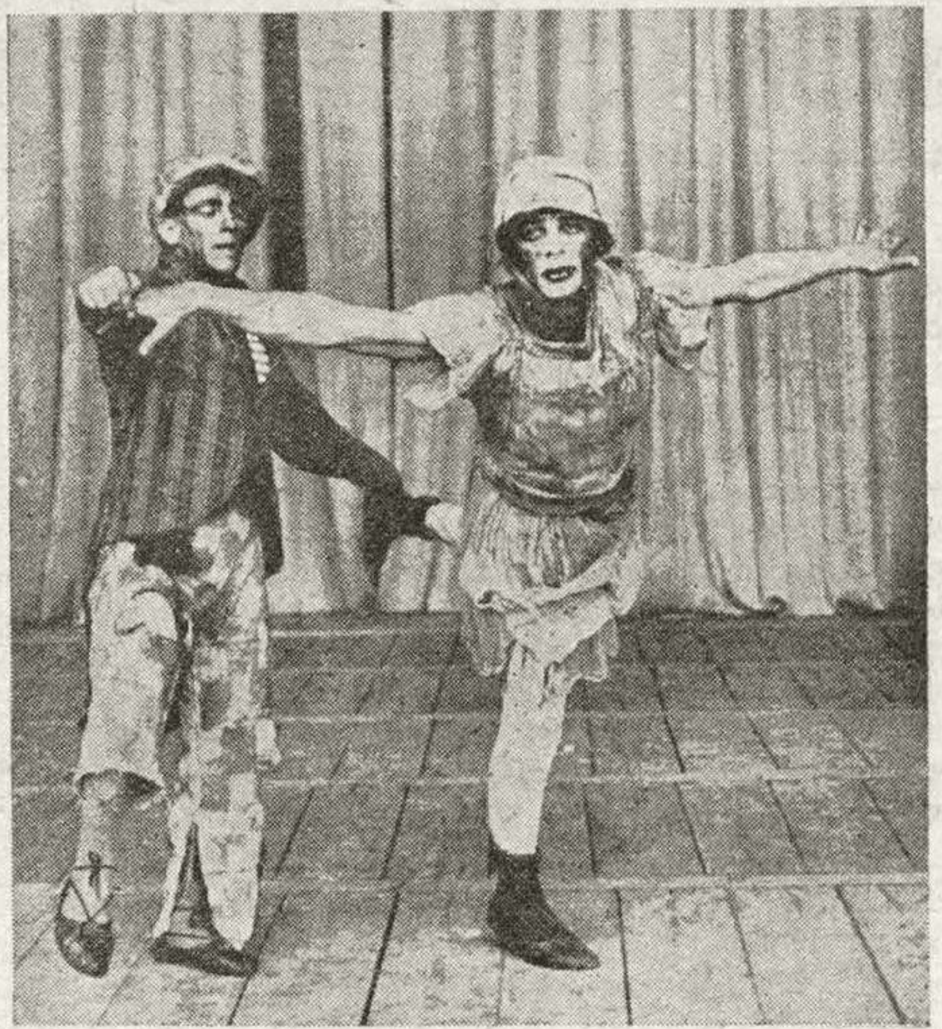
Краснофлотцы „Марата“ на конкурсе затейников (пародия на балет)

1 июня сделан первый опыт смычки „затейников“ с рабочими. По дворам жилищ рабочих заводов „Красного Выборжца“ и Металлического